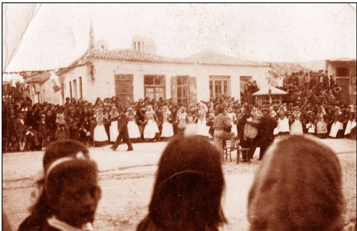
1930: Celebrating the 100th Anniversary of the “London Protocol of 1830” in Peania, Attica.