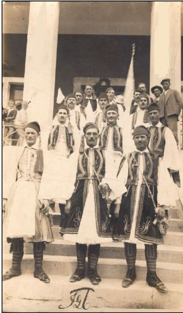
1930: Celebrating the 100 th Anniversary of the “London Protocol of 1830” in Peania, Attica